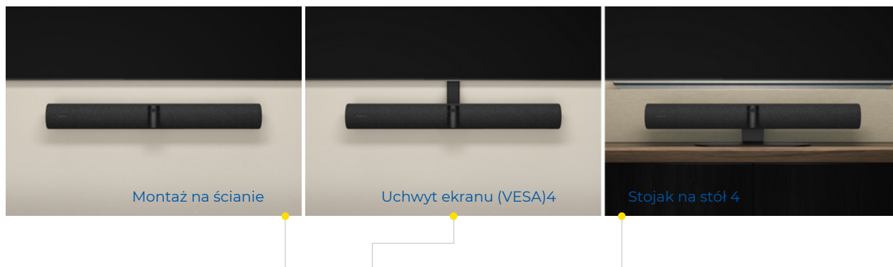
Montaż na ścianie

Instalacja PanaCast 50 jest prosta dzięki trzem różnym opcjom: uchwyt ścienny, stojak stołowy i uchwyt do ekranu (VESA) 4 . Instrukcje są jasne i łatwe do wykonania, niezależnie od wybranego pomieszczenia.